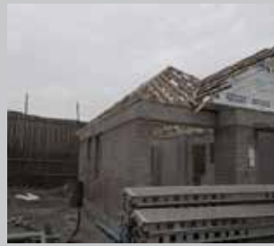
Techos a hormigón