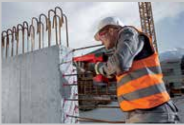
Unión de muros no estructurales