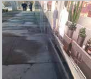
Anuncios en obra